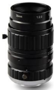
手动光圈镜头 C 接口 1"