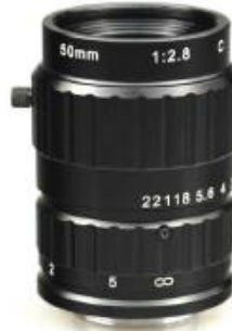
手动光圈镜头 C 接口 1"