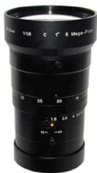
手动定焦镜头 C 接口 1"